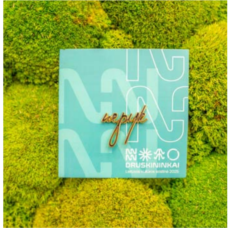
Akcijos simbolis – ženkliukas „nepyk“

Prisijungti prie iniciatyvos, susipažinti su jos taisyklėmis, parsisiųsti „nepyk“ identitetą galima www.nepyk.lt . Čia, užpildydami registracijos formą, pristatykite savo iniciatyvas. Pirmųjų dešimties užregistruotų iniciatyvų autoriams bus įteikti „Snow Arenos“ arba Druskininkų van-