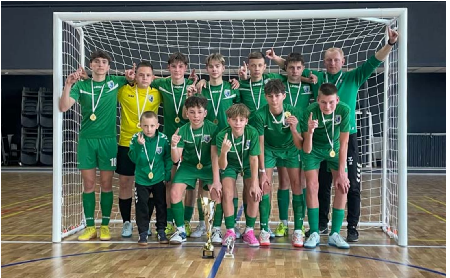
Jaunieji Druskininkų futbolininkai tapo Lietuvos čempionais – iškovota svarbi pergalė jiems suteikė labai daug džiaugsmo ir pasitikėjimo savo jėgomis