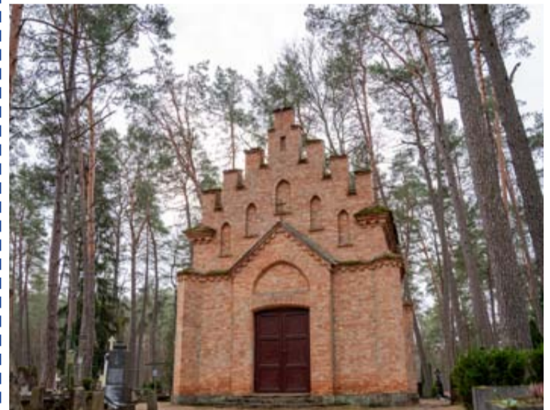
Šį statinį siūloma pripažinti bešeimininkiu

Druskininkų savivaldybės administracija kreipsis į teismą dėl pastato – Koplyčios, esančios adresu V. Kudirkos g. 2B, Druskininkuose, Druskininkų senose kapinėse , koordinatės X-5986156, Y-498157, kuri neturi savininko (ar savininkas nežinomas), pripažinimo bešeimininkiu turtu ir jos perdavimo Druskininkų savivaldybės nuosavybėn.