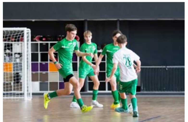
Jaunieji druskininkiečiai parodė savo stiprų charakterį, atsidavimą