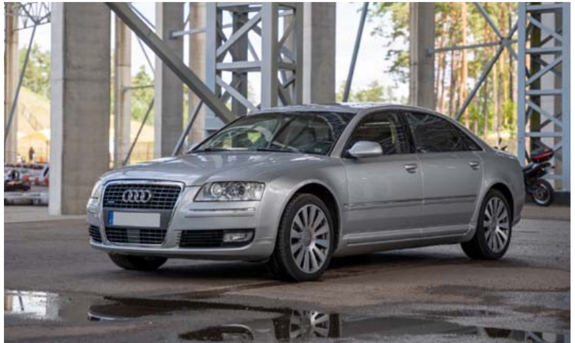
Parduodamas automobilis „Audi A8L“

Atsiskaitymo už aukcione nupirtą turto objektą tvarka ir terminai: