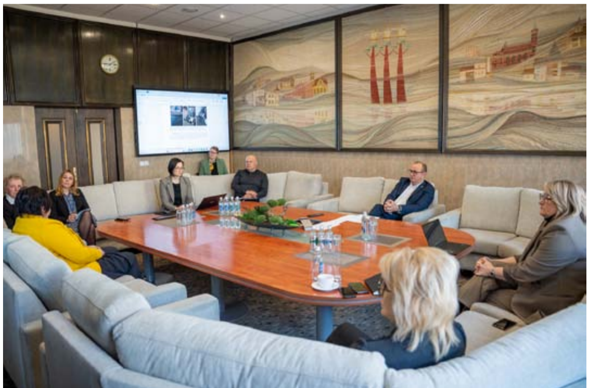
Druskininkų savivaldybės, Socialinių paslaugų centro ir Paslaugų ūkio vadovai bei specialistai aptarė gaisrų prevencijos klausimus, pagalbos galimybes sunkiau gyvenantiems bendruomenės nariams

Siekiant sumažinti šias rizikas, Paslaugų ūkis įsipareigojo apžiūrėti būstus, pašalinti pavojingus defektus ir atlikti būtinus darbus po šildymo sezono, kad gyventojai būtų tinkamai pasiruošę kitam šaltajam sezonui ir savo namuose galėtų jaustis saugiau.