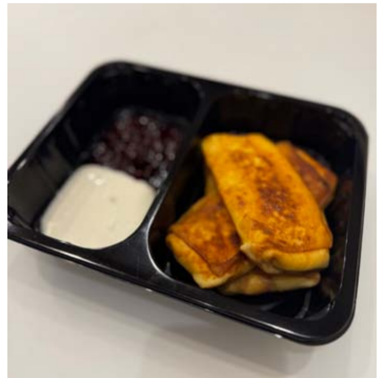
Maistas pristatomas vienkartinuose indeliuose