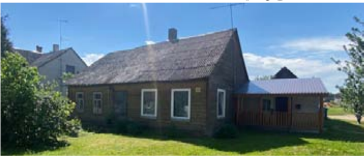
Leipalingyje parduodamas butas

Druskininkų savivaldybės administracija, skelbia dviejų kambarių buto, kurio bendras plotas 63,37 kv. m ir butui priskirtos 0,0456 ha ploto sklypo dalies bendrame 0,0900 ha ploto valstybinės žemės sklype, Druskininkų sav., Leipalingyje, Kapų g. 32 viešą turto pardavimo aukcioną.