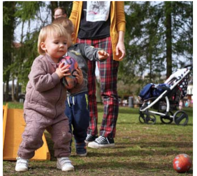
Būdami Lietuvos kultūros sostine, Druskininkai siūlo atrasti ne tik kultūrinius renginius, bet ir pagarbią bendravimo kultūrą