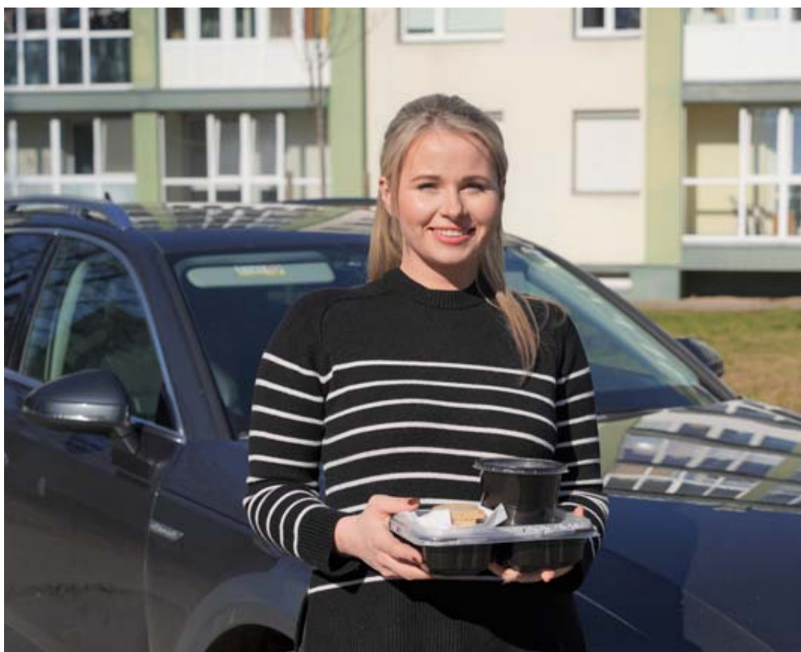
Užtenka vieną kartą užsakyti, ir maistas visą mėnesį darbo dienomis bus pristatytas iki pat Jūsų durų