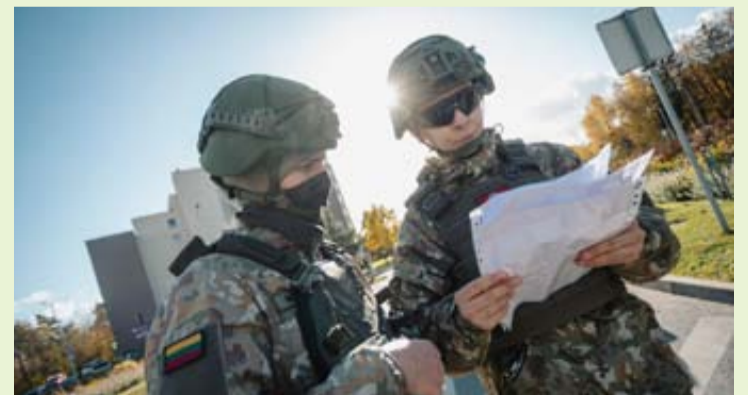
Lietuvos kariuomenė vykdys orientavimosi vietovėje pratybas Druskininkų miesto apylinkėse

Druskininkų savivaldybė informuoja, kad kovo 27 d. nuo 8.00 val. iki 16.00 val. Lietuvos kariuomenės Pėstininkų brigados „Geležinis vilkas“ Didžiosios kunigaikštienės Birutės ulonų bataliono kariai vykdys orientavimosi vietovėje pratybas Druskininkų miesto apylinkėse.