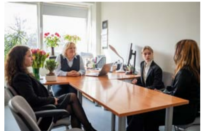
Entuziastingi ir smalsūs gimnazistai dalyvavo šešėliavimo savaitės renginyje, kurio metu jie turėjo unikalią galimybę pamatyti, kaip veikia vietos savivalda ir iš arti susipažinti su savivaldybės darbu