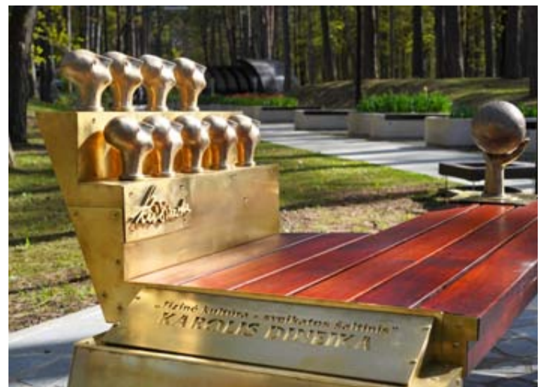
K. Dineikos sveikatingumo parke buvo pastatytas K. Dineikos atminimui skirtas suolelis