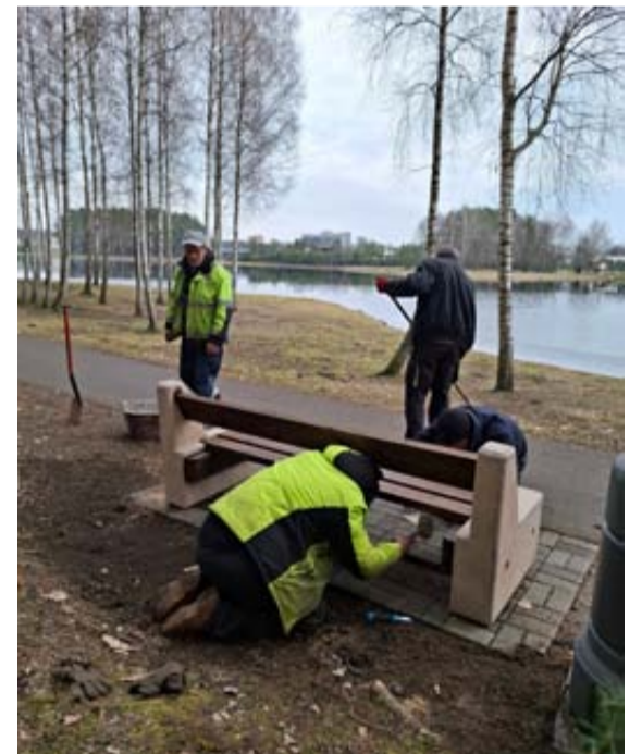
Šiomet pavasarinis miesto tvarkymas prasidėjo anksčiau, todėl iki šiltojo sezono pradžios bus atlikti visi būtini darbai – kurortas džiugins tvarka bei švara

kaip galimybę „įdarbinti“ aukšto slėgio plovimo įrangą. Tai yra nauja mūsų darbo galimybė. Aukštu slėgiu plauname viską – medieną, betono konstrukcijas, metalą, plyteles. Kai vieni viską nuplauna, kita darbuotojų brigada viską perdažo. Turime pakeitimui lentų, jas frezuojame, im-