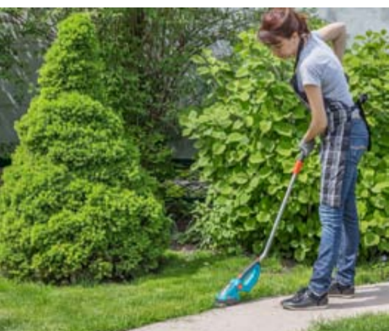
Druskininkų savivaldybė kviečia visus gyventojus pasirūpinti savo aplinka, laikantis Tarybos nustatytų Druskininkų savivaldybės tvarkymo ir švaros taisyklių / Asociatyvi nuotrauka

Druskininkai garsėja ne tik unikaliais gamtos ištekliais, sveikatingumo tradicijomis, bet ir tvarkinga bei estetiška aplinka. Savivaldybė dėkoja visiems gyventojams, kurie rūpinasi savo teritorijų tvarka ir prisideda prie bendros kurorto estetikos puoselėjimo. Jūsų atsakingumas ir pastangos kuria malonią, saugią ir gražią aplinką mums visiems.