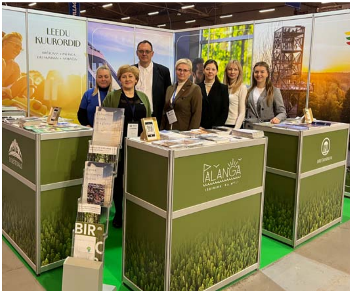
Druskininkų TVIC su mūsų krašto verslo atstovais savo paslaugas pristatė seniausioje Baltijos šalyse turizmo parodoje „Tourest 2025“