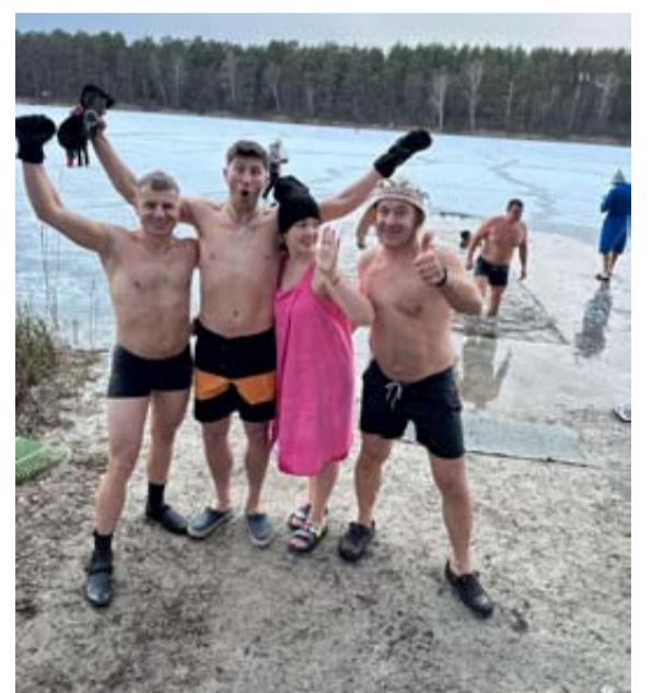
Grūto kaimo bendruomenės nariai vasario 15-ąją ledinių maudynių entuziastus ir norinčiuosius jas išmėginti pakvietė į pirmąsias „ruonių“ maudynes Grūto ežere iškirtoje eketėje