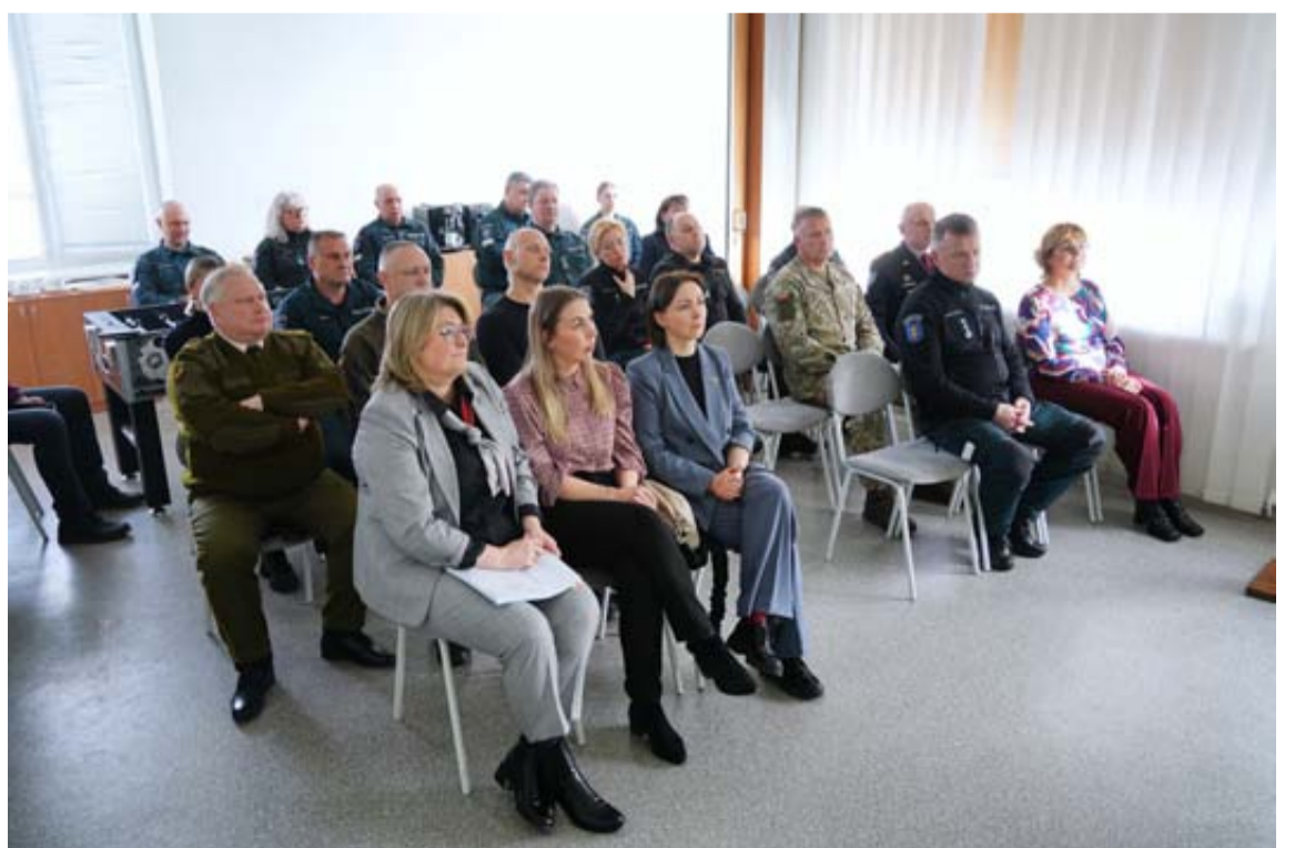
Praėjusį ketvirtadienį Druskininkų savivaldybės atstovams, apskrities policijos vadovams, socialiniams partneriams pristatyta Druskininkų policijos komisariato 2024 metų veiklos ataskaita