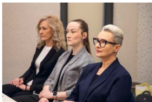
Į renginį „Asmenų su negalia įtrauktis: naujos paslaugos ir sprendimai“ susirinko savivaldybės atstovai ir specialistai, siekiantys geriau suprasti negalią turinčių asmenų situaciją bei ieškoti būdų, kaip pagerinti jų gyvenimo kokybę

Praėjusį ketvirtadienį Druskininkų vandens parko didžiojoje konferencijoje salėje organizuotas renginys „Asmenų su negalia įtrauktis: naujos paslaugos ir sprendimai“. Į jį susirinko savivaldybės atstovai ir specialistai, siekiantys geriau suprasti negalią turinčių asmenų situaciją bei ieškoti būdų, kaip page-