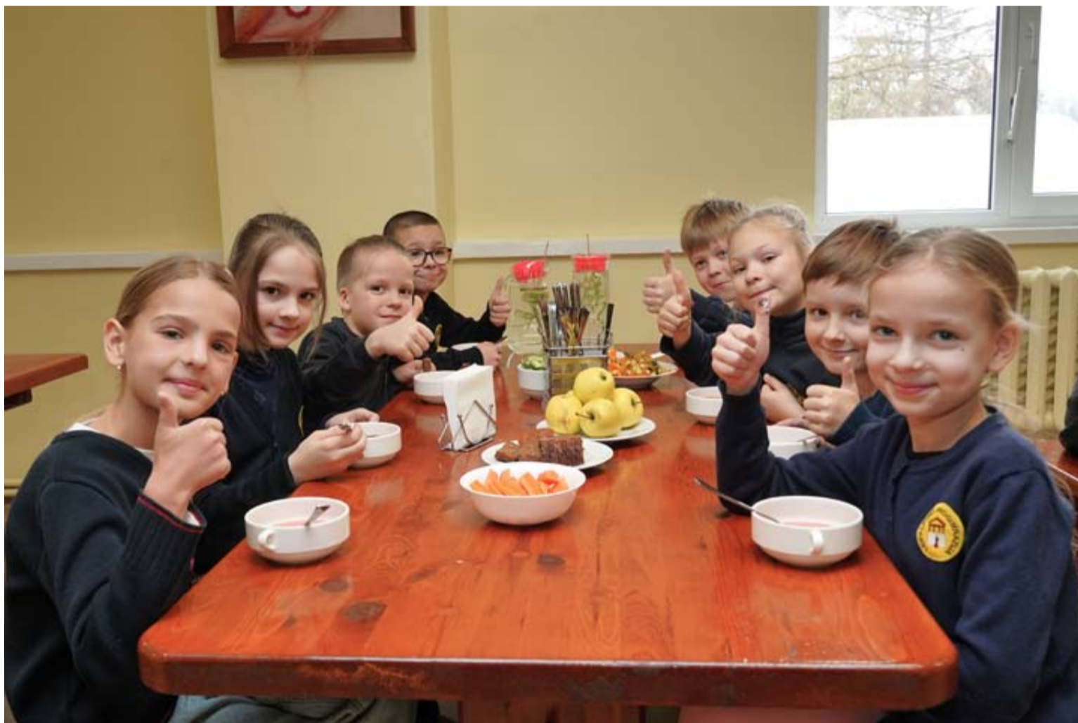
Leipalingio progimnazijos moksleiviai jau spėjo įvertinti atnaujintą mokyklos valgyklos valgiaraštį