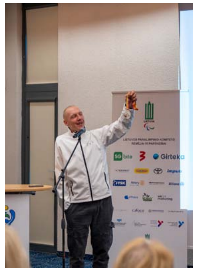
Lietuvos parolimpinio komiteto organizuotas seminaras „Visi kartu: kelias į įtraukią mokyklą“ sukvietė 170 Druskininkų krašto pedagogų, jų padėjėjų, trenerių, socialinių darbuotojų ir kitų sričių specialistų