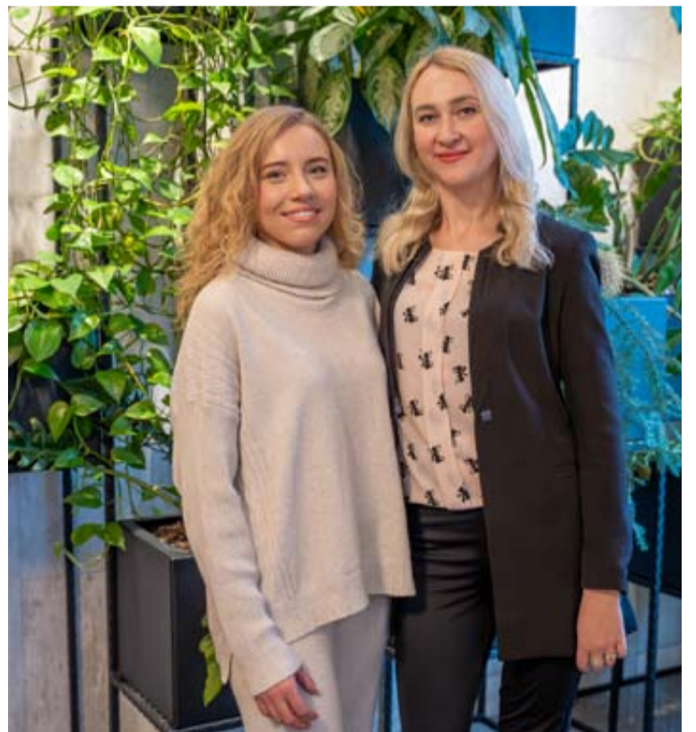
Druskininkų savivaldybės visuomenės sveikatos biuro mitybos specialistės G. Kaminskaitė ir A. Grincevičiūtė