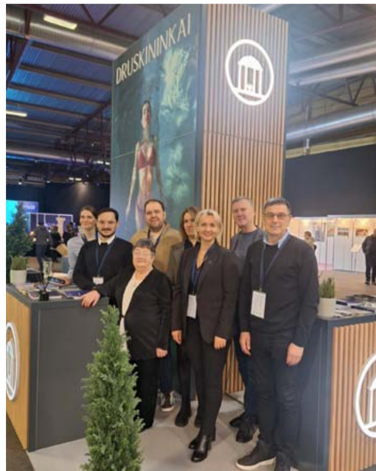
Druskininkų TVIC darbuotojai kartu su verslo atstovais dalyvavo Rygoje surengtoje parodoje „Balttour 2025“