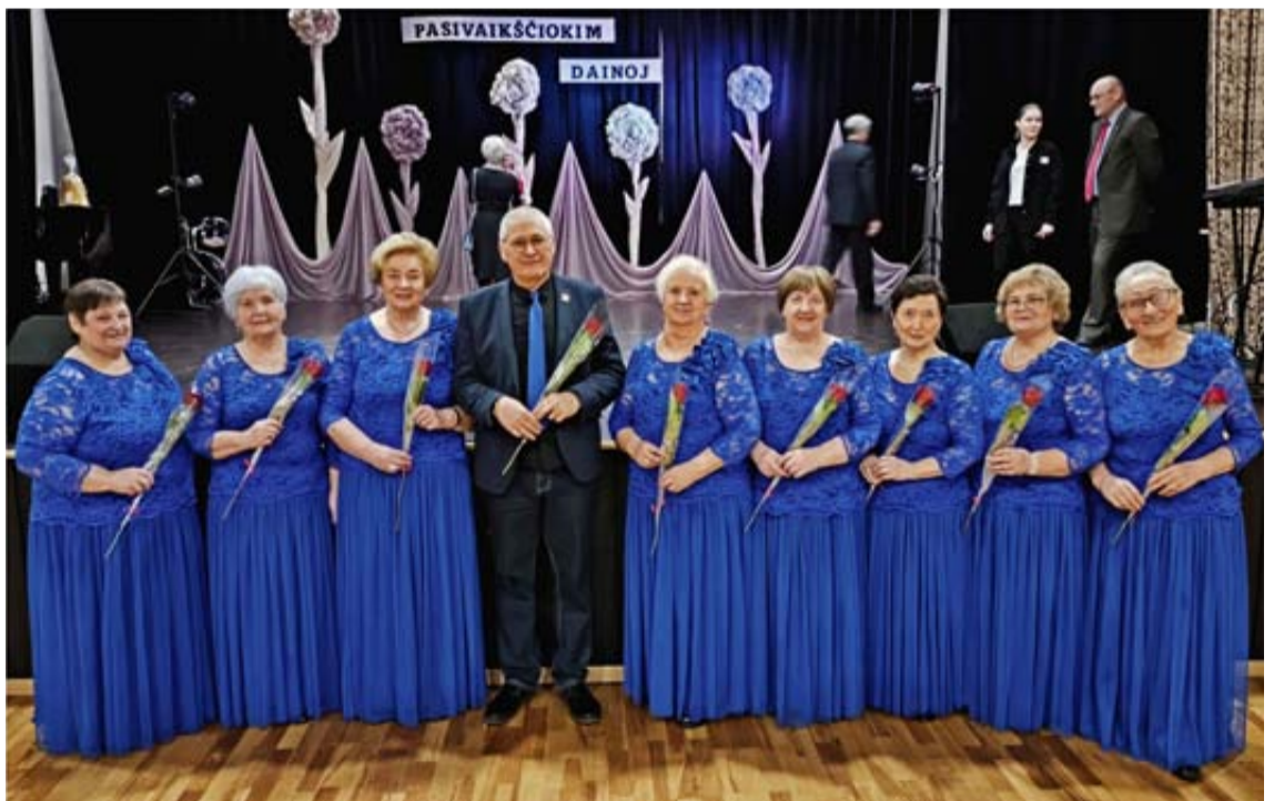
Ansamblis „Rasa“ „Draugystės sanatorijoje“ koncertuoja kas mėnesį, jis laukiamas ne tik Druskininkuose, bet ir kituose Lietuvos regionuose