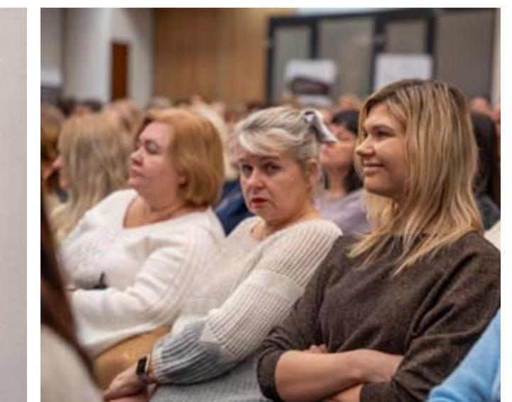
Dokumentinio filmo „Aš esu“ peržiūra tapo ne tik kino seansu, bet ir galimybe geriau pažinti autizmo spektro sutrikimų turinčių vaikų bei jų artimųjų išgyvenimus