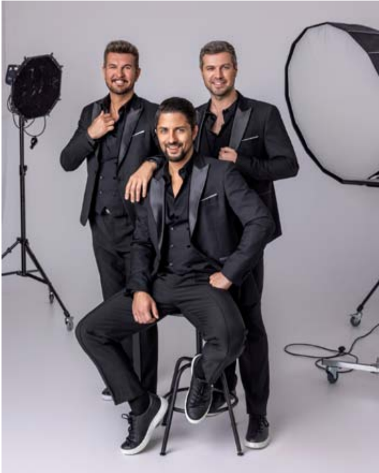
„Džentelmenai“ surengs įspūdingą koncertą Druskininkų „Eglės sanatorijoje“

Šiomet bus 17 metų, kai iš šio pasaulio iškeliavo atlikėjas Alvydas Lukoševičius-Obuolys. Metai bėga, o jo muzikinis palikimas ir toliau jaudina lietuvių širdis, atranda vis naujus klausytojus. Turbūt daugeliui puikiai pa-