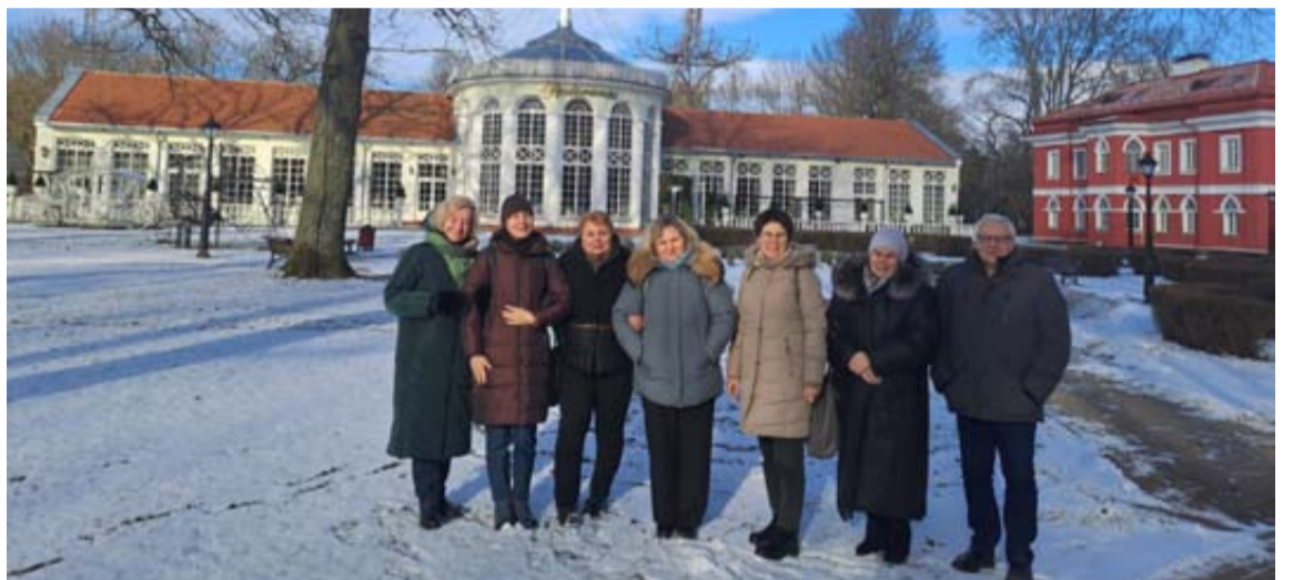
Druskininkų savivaldybės mokyklų istorijos mokytojai aplankė Kauno rajono Vilkių gimnaziją ir Raudondvario pilį