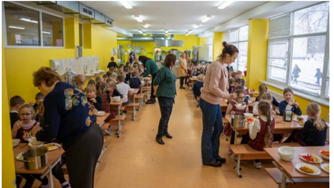
Prieš metus pasikeitus vaikų maitinimo sistemai, Druskininkų savivaldybės mokyklų moksleiviai dabar gali mėgautis kokybišku ir subalansuotu maistu