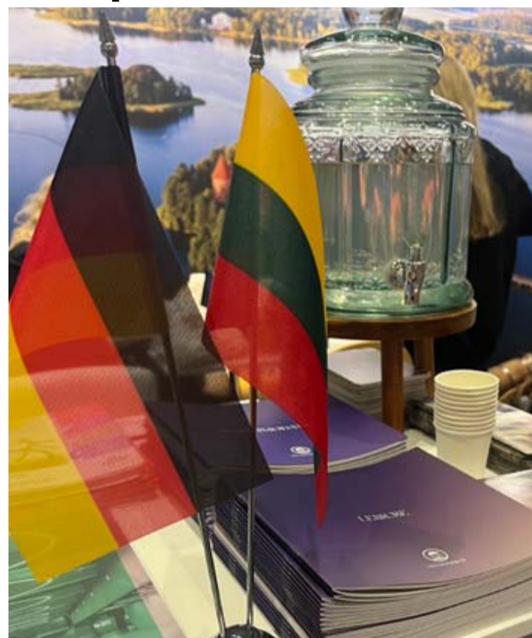
Mineralinis vanduo – tiesiai iš Druskininkų gręžinio