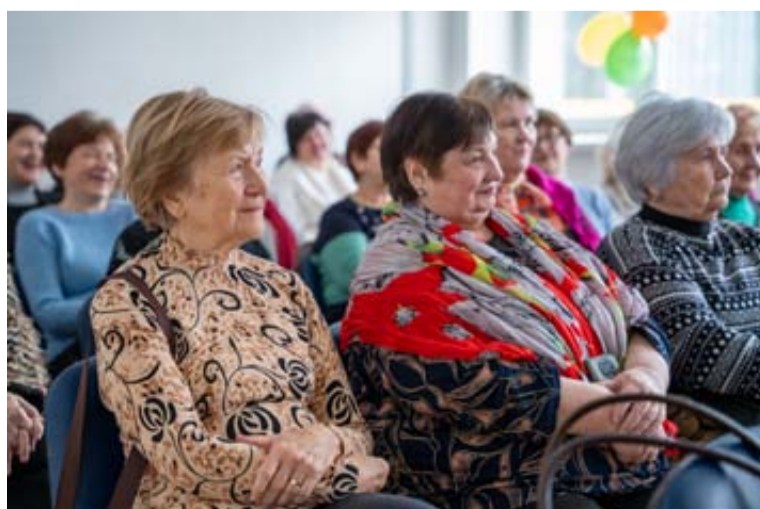
Druskininkų „Bočių“ bendruomenė surengė susitikimą, skirtą sveikatos klausimams aptarti