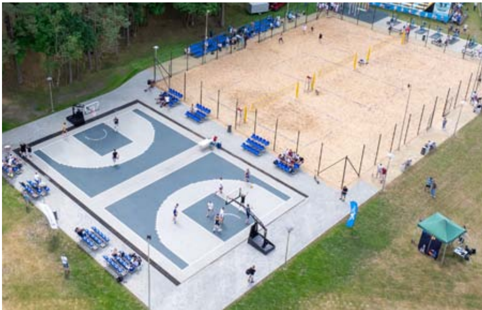
Kurorto erdvės ir čia esantys sporto objektai pritaikyti pačioms įvairiausioms sporto šakoms