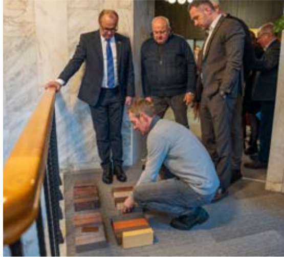
Druskininkų savivaldybės vadovai ir specialistai susitikime su rangovais aptarė svarbius Vilniaus alėjos rekonstrukcijos aspektus