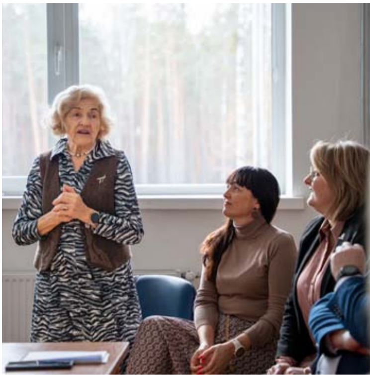
„Bočių“ bendrijos nariai padėkojo sveikatos įstaigų vadovams už darbą ir išskėlė įvairių klausimų

Pirmadienį Druskininkų „Bočių“ bendruomenė surengė susitikimą, skirtą sveikatos klausimams aptarti.