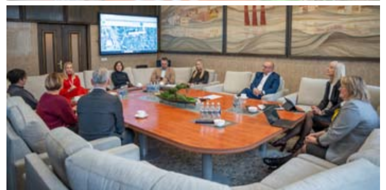
Susitikimo metu aptartos aktualios sveikatos priežiūros temos, susijusios su „Saulutės“ sanatorijos veikla, Druskininkų ligoninės ir VšĮ Vilniaus universiteto ligoninės Santaros klinikų bei „Saulutės“ bendradarbiavimu

metu gydoma apie 110 vaikų iš visos Lietuvos, jau nekalbant apie druskininkiečių ir turistų atžalas, kurioms taip pat gali būti teikiama medicininė pagalba. Tai reiškia, kad be tinkamos medicininės infrastruktūros užtikrinti sklandų sveikatos priežiūros paslaugų teikimą regione būtų sudėtinga.