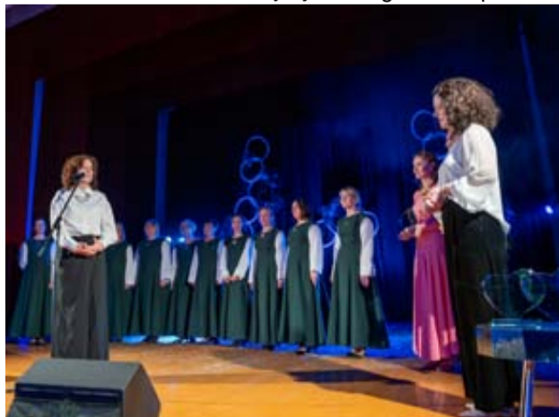
Apdovanojimas „Metų debiutas“ įteiktas šokių kolektyvui „Liepos“ ir jų vadovei A. Čmukienei