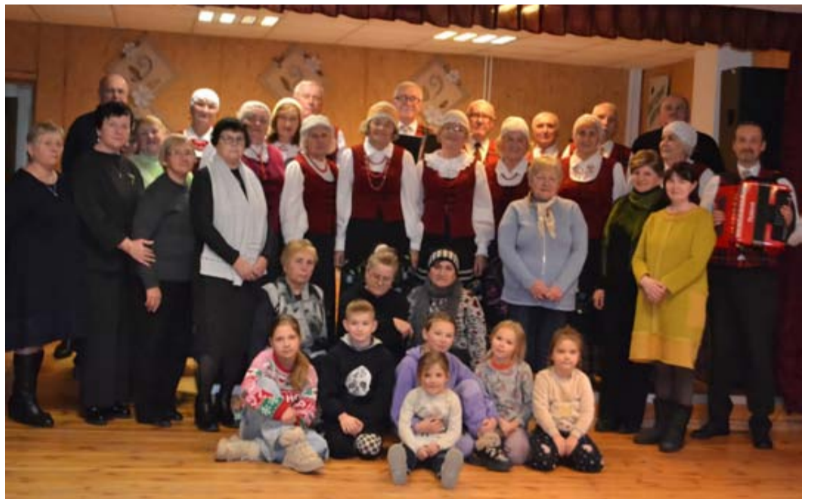
Advento laiku „Bočiai“ su ansambliu „Vijūna“ surengė daugybę vakaronių įvairiose Druskininkų vietose ir Kalvarijos rajone