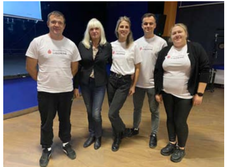
Po įnirtingų kovų ir puikiai atliktų užduočių Druskininkų ligoninės komanda, surinkusi daugiausiai taškų, iškovojė pirmąją vietą