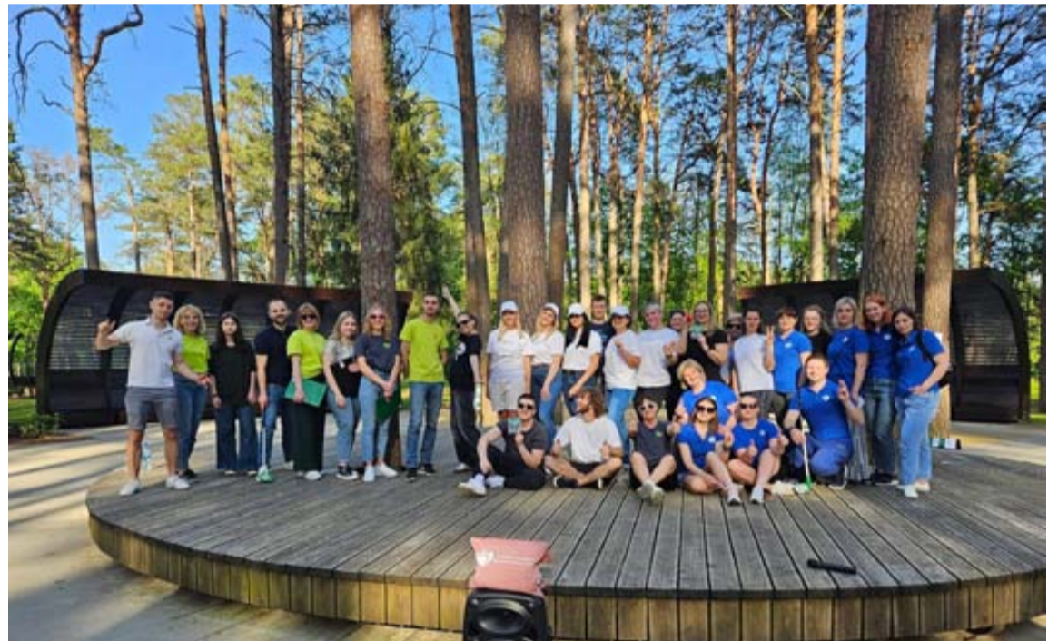
Šiame Druskininkų savivaldybės VSB pakvietė vietas įstaigas dalyvauti unikaliame renginyje – įstaigų kovose

Ūkininkas perka mišką, žemę, gali būti su sodyba, domina didesnis plotas. Visoje Lietuvoje. Prie vandens mokama iki 1000 Eur už 1 metrą pakrantės. Tel. +370 611 01110