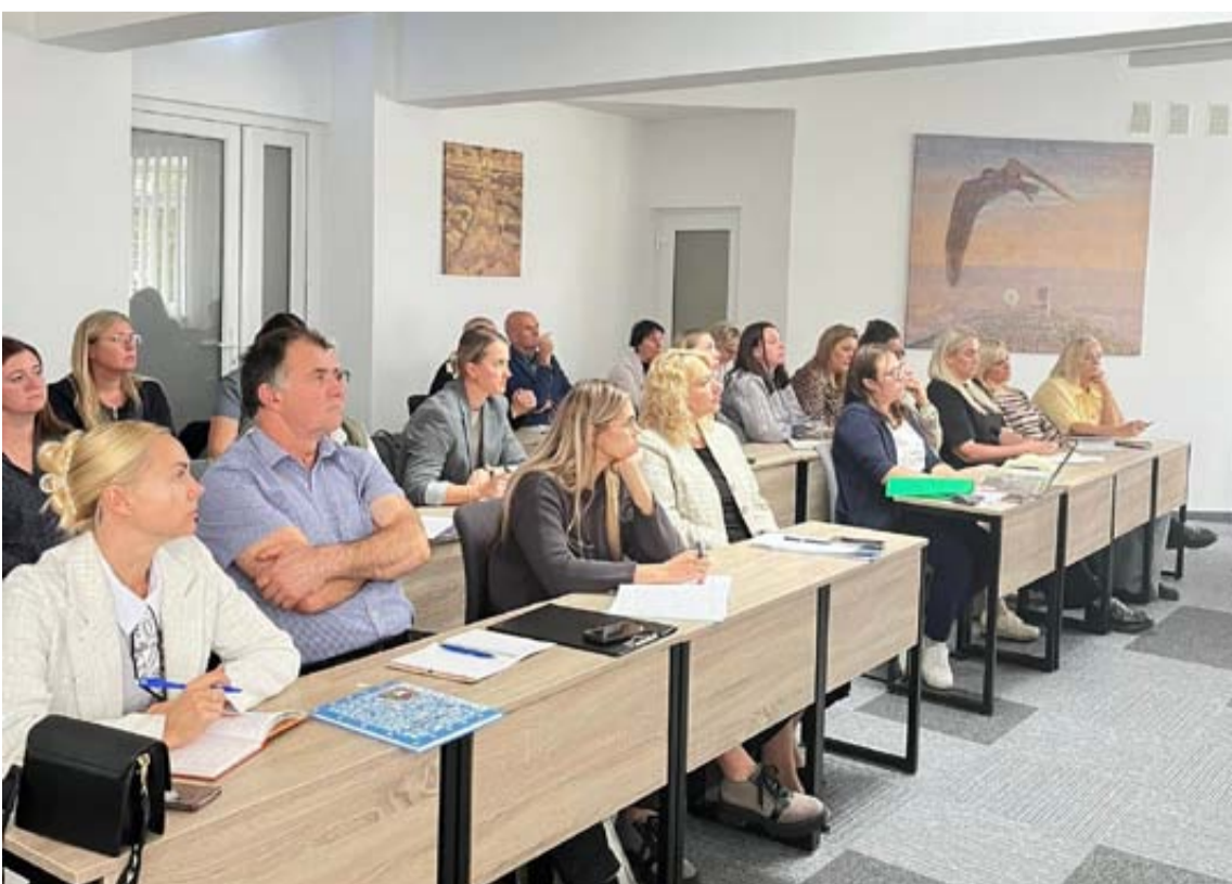
Pirmojo pasitarimo dalyviai

Grupės nariai, besibaigiant pirmajam mokslo metų pusmečiui, sausio-vasario mėnesiais planuoja apsilankyti visose mokyklose aptarti įgyvendintų priemonių efektyvumą bei poveikį.