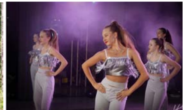
Jaunimo iniciatyvų veiklų akimirkos