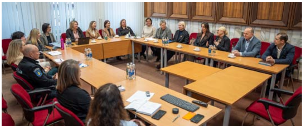
Druskininkų savivaldybės smurto artimoje aplinkoje komisijos posėdyje dalyvavo ne tik Druskininkų savivaldybės komisijos nariai, bet ir kviestiniai svečiai iš Alytaus