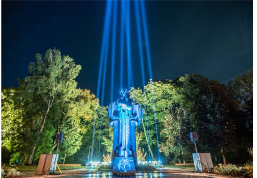
„Čiurlionio paliesti“ – tokia pagrindinė 2025 metų Lietuvos kultūros sostinės Druskininkų tema

Druskininkai siekia ne tik atskleisti Čiurlionio kūrybos daugialypiškumą, bet ir įkvėpti jaunąją kartą novatoriškiems meno projektams.