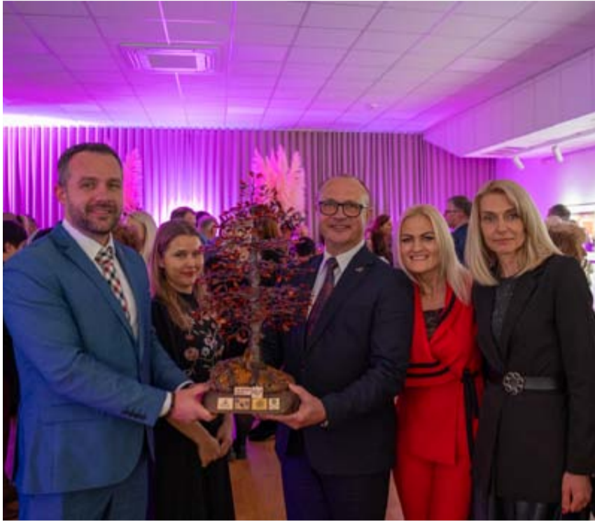
Lietuvos kultūros sostinės titulą perėmė Druskininkai