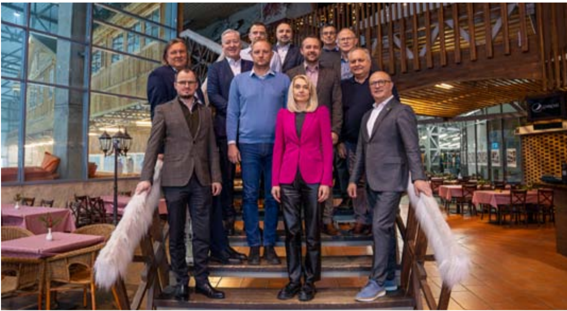
Druskininkų savivaldybės Turizmo tarybos posėdyje aptarti svarbūs kurorto vystymo ir turizmo sektoriaus klausimai

Praėjusį ketvirtadienį dieną organizuotas Druskininkų savivaldybės Turizmo tarybos posėdis, kuriame aptarti svarbūs kurorto vystymo ir turizmo sektoriaus klausimai.