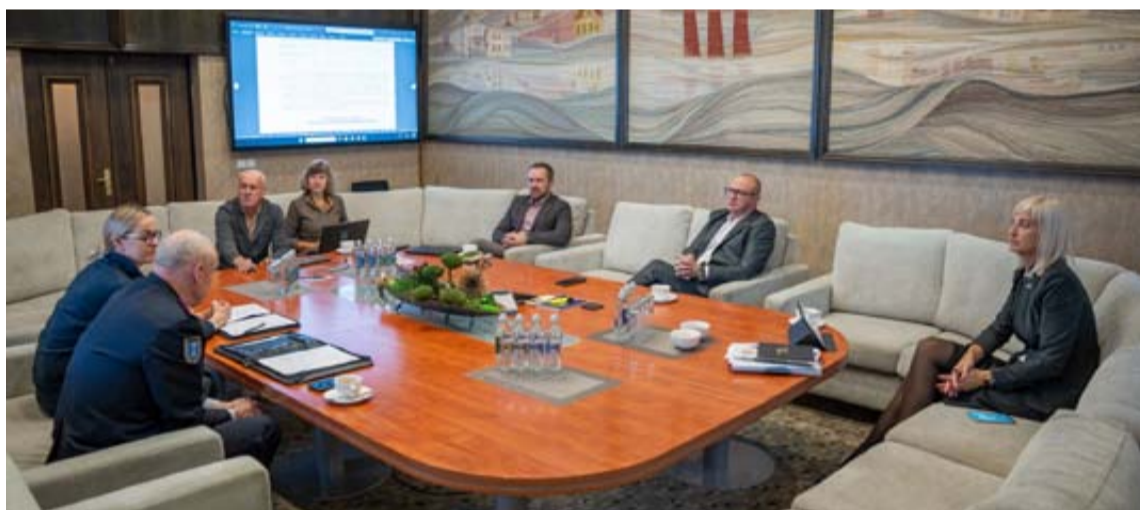
Druskininkų savivaldybės vadovai, administracijos specialistai ir Druskininkų PGT atstovai aptarė 2025 metų veiklos plano prevencinę programą

Praėjusią savaitę Druskininkų savivaldybės vadovai, administracijos specialistai ir Druskininkų priešgaisrinės gelbėjimo tarnybos (PGT) atstovai aptarė 2025 metų veiklos plano prevencinę programą, skirtą užtikrinti efektyvią gaisrų prevenciją ir gelbėjimo darbų organizavimą savivaldybės teritorijoje.