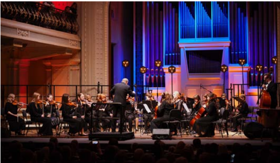
Kamerinį chorą „Druskininkai“ ir Vilniaus B. Jonušo muzikos mokyklos styginių instrumentų orkestrą sieja graži, ilgametė kūrybinė draugystė