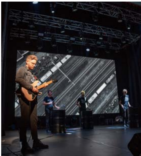
Prestižinis Kultūros sostinės statusas suteiks galimybę Druskininkams ne tik parodyti savo kultūrinį potencialą, bet ir dar labiau sustiprins kultūros bei turizmo sektorių