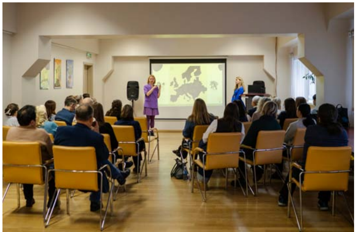
Druskininkų JUC džiaugiasi sėkmingai surengta praktine konferencija „Psichinė sveikata komikso puslapiuose“ / „G. Z. fotografija“ nuotrauka