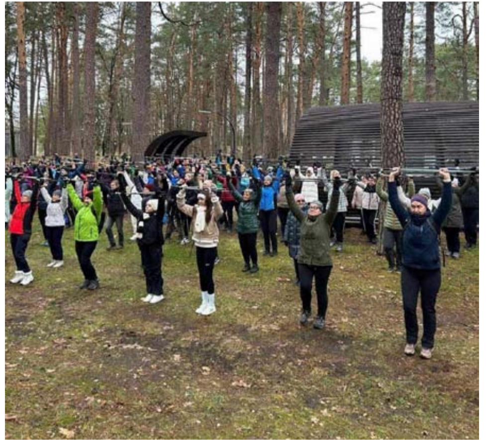
Druskininkuose susibūrė didelis būrys šiaurietiško ėjimo entuziastų iš visos Lietuvos miestų bei miestelių

Šiaurietiškas ėjimas – puiki fizinio aktyvumo ir sveikatos saugojimo bei stiprinimo forma, tinkanti bet kokio amžiaus žmonėms, bet kokiu oru ir bet kuriuo metų laiku. Kai einama, gerai įvaldžius techniką, dirba iki 90 procentų viso kūno raumenų. Dar visai neseniai šiaurietiškas ėjimas buvo mažai kam žinomas ir atrodė gana neįprastai. Dabar šis ėjimo būdas yra labai populiarus, ir