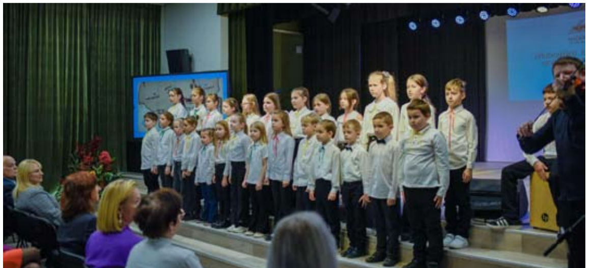
Druskininkų „Atgimimo“ mokykloje surengtas 14-asis Partizanų dainų festivalis „Laisvės kelias“