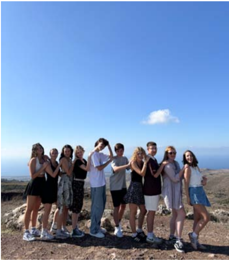
Druskininkų JUC darbuotojos su 10 jaunuolių grupe dalyvavo Kipre, Pafoso mieste organizuotuose tarptautiniuose jaunimo mainuose „Vienybės aidai: kelionė per kultūras“

VšĮ Druskininkų jaunimo užimtumo centras (JUC) aktyviai dalyvauja tarptautinėse veiklose, taip skatindamas jaunimą atrasti naujas galimybes, plėsti akiratį bei kurti ryšius. Per pastarąjį mėnesį realizuoti trys ypatingi projektai: praktinė konferencija apie psichinę sveikatą, įkvepiantys jaunimo mainai Kipre, kur buvo stiprinamas tarpkultūrinis supratimas, ir jaunimo mainai Ispanijoje, pakvietę jaunimą tapti technologijų ir dirbtinio intelekto balsais. Šie projektai ne tik praturtino dalyvių gyvenimus, bet ir atvėrė kelius tarptautinėms draugystėms.