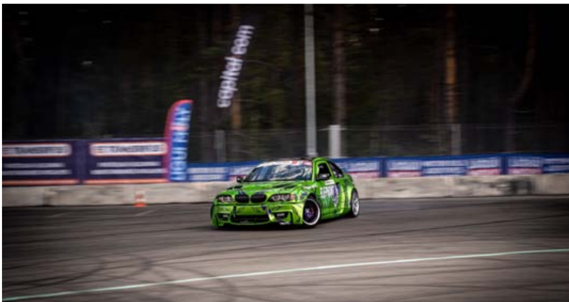
„Drift arena“ atstovai pažadėjo sumažinti automobilių kelią triukšmą

Druskininkų savivaldybė pastaruoju metu sulaukė gyventojų ir kurorto svečių klausimų dėl garsų, sklindančių iš buvusios sunkvežimių aikštelės Gardino gatvės pabaigoje.