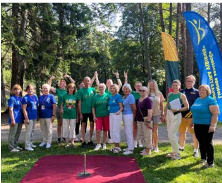
Festivalio „Aukšnis amžius“ akimirka