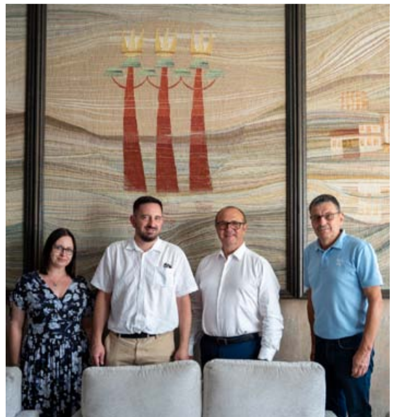
Svečiai iš Supraslio (Lenkija) ir TVIC atstovai savivaldybėje aptarė bendrai įgyvendinimą projektą „Atradimas ir populiarinimas Supraslio ir Druskininkų kurortų turistinių vertybių“

Praėjusių savaitę Druskininkų savivaldybėje lankėsi Supraslio (Lenkija) miesto meras ir specialistai, kurie su Druskininkų turizmo ir verslo centro atstovais aptarė bendrai įgyvendinimą projektą „Atradimas ir populiarinimas Supraslio ir Druskininkų kurortų turistinių vertybių“.