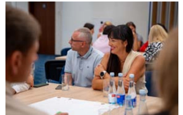
Savivaldybės vadovų, administracijos atstovų ir švietimo įstaigų vadovų bei jų pavaduotojų konferencijoje buvo aptartas Druskininkų savivaldybės švietimo įstaigų pasirengimas 2024-2025 mokslo metams