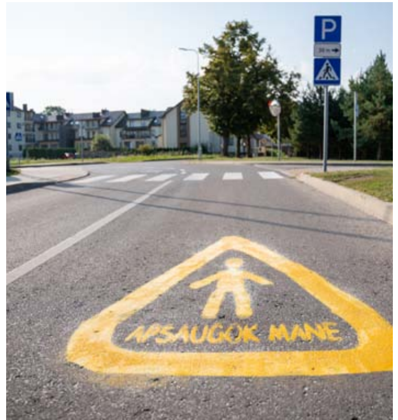
„Apsaugok mane“ – jau 25-erius metus gyvuojanti socialinės atsakomybės akcija, kurios metu kasmet rugsėjo mėnesį visi šalies moksleiviai yra nemokamai apdraudžiami nuo nelaimingų atsitikimų keliuose

„Rugsėję visiems šalies moksleiviams visą parą galioja draudimo apsauga. Šia akcija siekiame didinti visuomenės dėmesį vaikų saugumui ir mažinti ne-