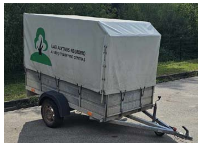
ARATC informuoja, kad galima nemokamai pasinaudoti priekaba didelių gabaritų ir kitoms atliekoms vežti

Alytaus regiono atliekų tvarkymo centro informacija