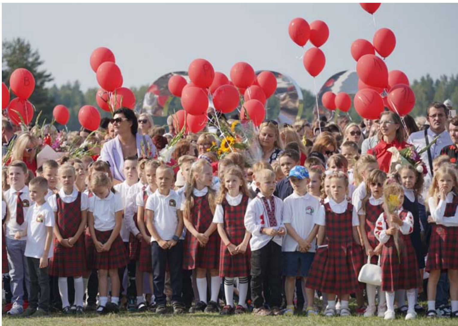
Šiemet moksleiviai, jų tėveliai ir mokytojai mokslo metų pradžią švęsti rinkosi ne į savo mokyklas, bet į bendrą, visas mokyklas sukvietusią erdvę – Druskininkų aerodromą