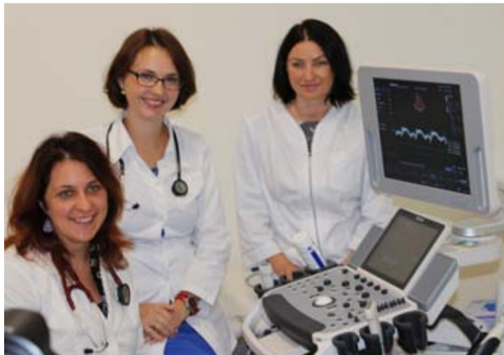
Druskininkų kardiologijos centre pacientus konsultuoja ir tyrimus atlieka aukštos kvalifikacijos gydytojai kardiologai

Registracija tel. +370 623 49997, Sveikatos g. 30B, Druskininkai.