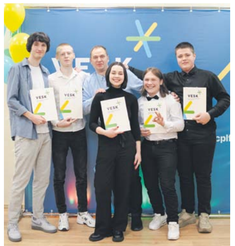
VESK Pietų Lietuvos filiale surengtoje profesinio mokymo diplomų įteikimo ceremonijoje diplomai įteikti 76-iesiems profesinio mokymo mokiniams, baigusiems padavėjo ir barmeno, ikimokyklinio ugdymo pedagogo padėjėjo, e. parduotuvės-konsultanto, kompiuterinio projektavimo operatoriaus modulines profesines mokymo programas