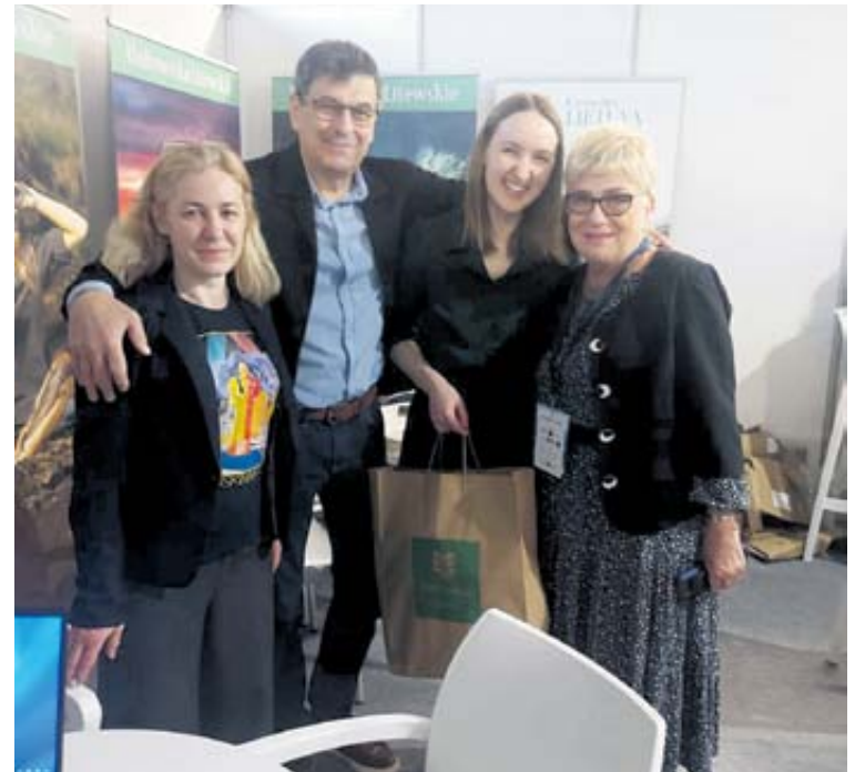
Druskininkų turizmo ir verslo informacijos centro darbuotojai, „Eglės sanatorija“ ir „Grand SPA Lietuva“ kartu su kolegomis iš Palangos, Birštono ir Kauno regiono buvo ypatingi svečiai, globjami organizatorių ir miesto vadovų

„Ši mugė yra unikalus įvykis mūsų regione ir šalyje. Tai – kelionių šventė, rengiama Silezijos aglomeracijoje, turinčioje daugiau kaip 2 mln. gyventojų, netoli Gliwicų, Chorzovo, Bytomo ir Katowicų“, – taip jau 14-us metus Lenkijos mieste Zabrze vykstančią tarptautinę turizmo parodą apibūdina ją organizuojanti šio miesto savivaldybė.