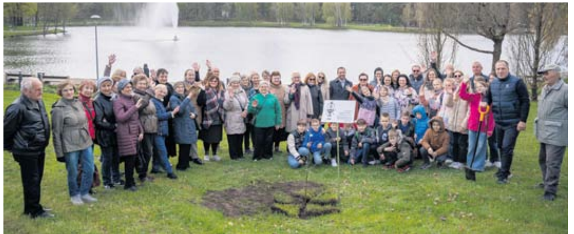
Minint Pasaulinę kultūros dieną prie Druskonio ežero pasodintas ažuoliukas, skirtas šimtmetį mininčios Lietuvos dainų šventės „Kad giria žaliuotų“ jamžinimui

Kviečiame visus norinčius dalyvauti šventėje bei prisidėti prie Lietuvos miškingumo didinimo registruotis: https://registracija.vmu.lt/ .