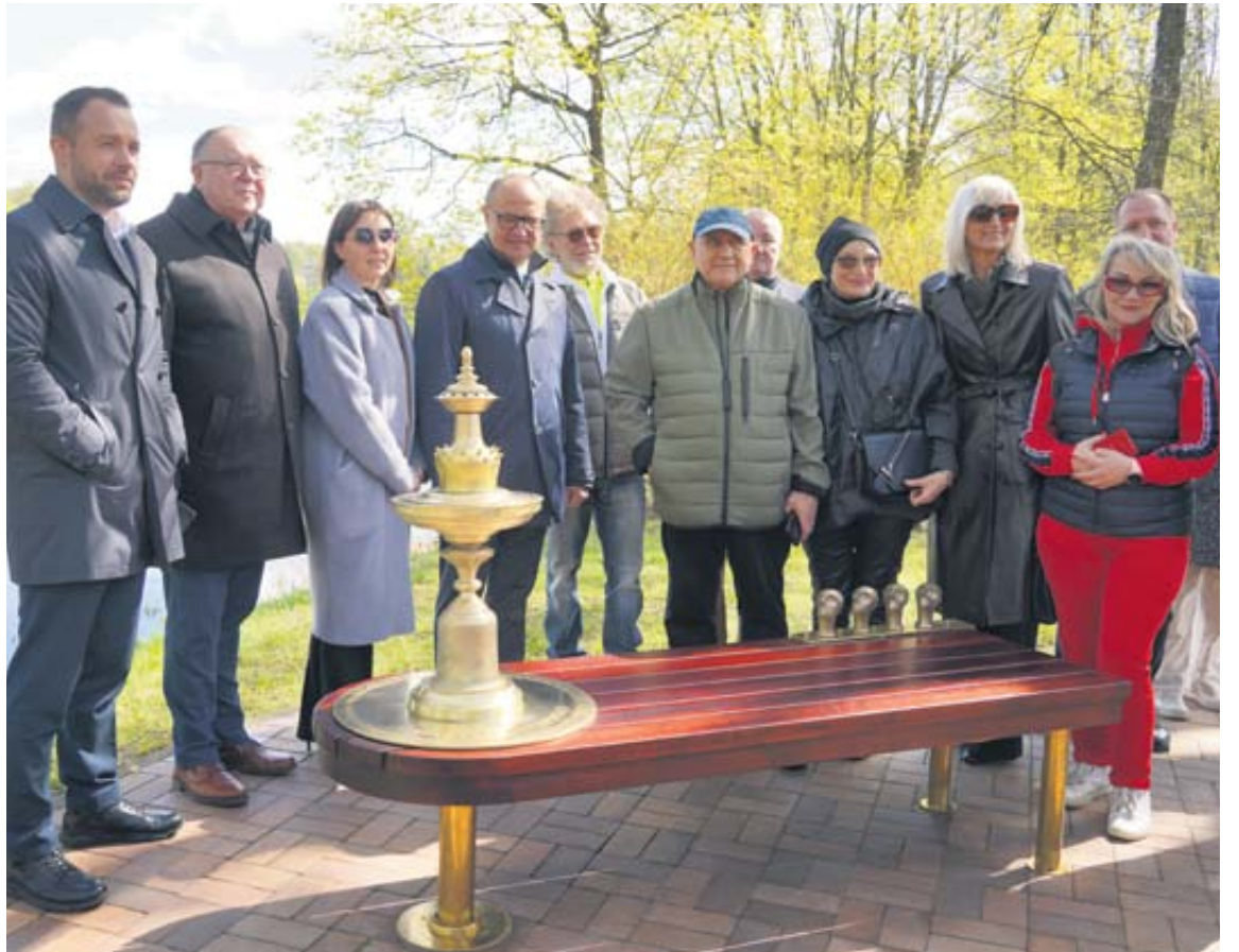
I. Fonbergo atminimo suolelis pastatytas Gydyklų parke, netoli mineralinio vandens biuvetės