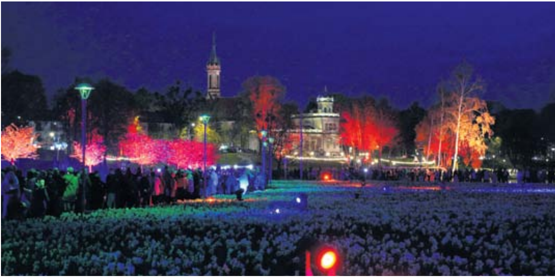
Tie, kas praėjusį savaitgalį nespėjo atvykti į Druskininkus, nepakeliavo narcizų labirintais, tai gali stebėti visą šią savaitę – iki pat sekmadienio, kai kasdien, sutemus, nuo 21 iki 23 valandos kaskart iš naujo kuriamas stebuklas

Akivaizdu, kad praėjusio savaitgalio Lietuvos socialinių tinklų „bomba“ tapo fantastiški Druskininkų narcizų žydėjimo šventės vaizdai. Tūkstančiai žmonių ir dieną, ir sutemus, fotografavo, filmavo narcizus, kūrė asmenukes, keletą dienų iš eilės socialiniuose tinkluose dalijosi ir dabar tebesidalija nepakartojamais vaizdais iš Druskininkų.