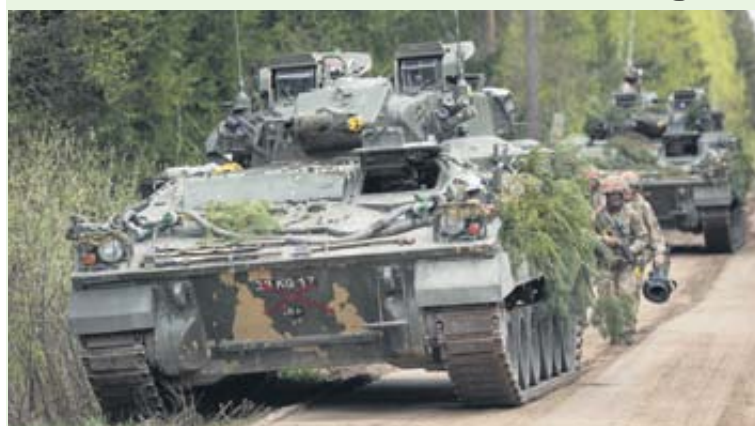
Druskininkų savivaldybės teritorijoje rengiamos Lietuvos kariuomenės Pėstininkų brigados „Geležinis vilkas“ Didžiosios kunigaikštienės Birutės ulonų bataliono pratybos

Balandžio 15-18 dienomis Druskininkų savivaldybės teritorijoje rengiamos Lietuvos kariuomenės Pėstininkų brigados „Geležinis vilkas“ Didžiosios kunigaikštienės Birutės ulonų bataliono pratybos. Pratybos vyks šviesiu ir tamsiu paros metu, bus naudojamos ratinės ir vikšrinės transporto priemonės, imitaciniai šaudmenys bei pirotechninės priemonės.