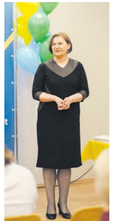
VESK Pietų Lietuvos filialo direktorė L. Vaitiekūnienė

Antradienį Verslo ir svetingumo profesinės karjeros centro (VESK) Pietų Lietuvos filiale surengtoje profesinio mokymo diplomų įteikimo ceremonijoje diplomai įteikti 76-iesiems profesinio mokymo mokiniams, baigusiems padavėjo ir barmeno, ikimokyklinio ugdymo pedagogo padėjėjo, e. parduotuvės-konsultanto, kompiuterinio projektavimo operatoriaus modulines profesines mokymo programas.