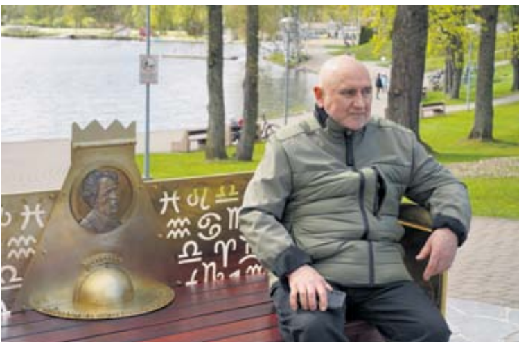
Visų keturių atminimo suolelių autorius – skulptorius R. Inčirauskas