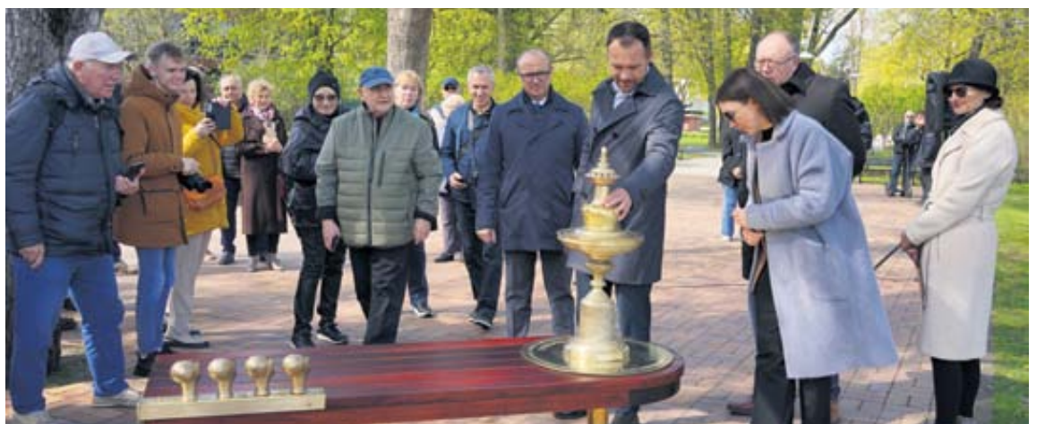
I. Fonbergo atminimo suolelis pastatytas Gydyklų parke