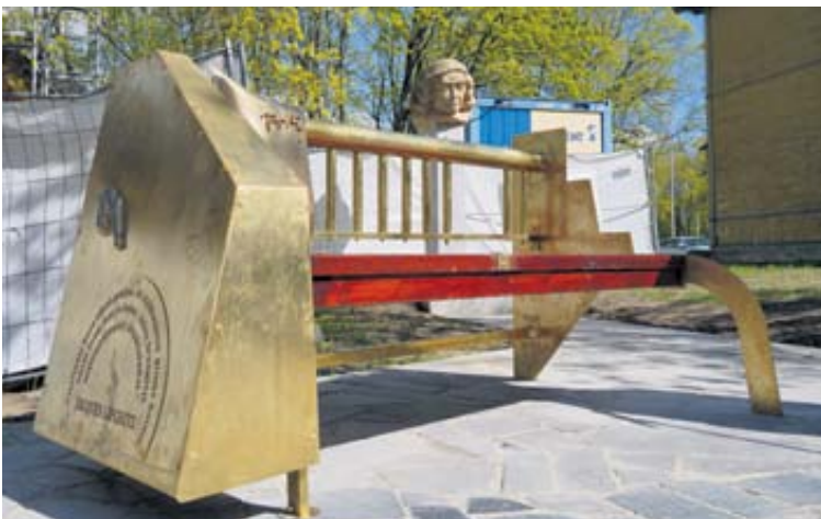
Ž. Lipšico atminimui skirtas sukurtas suolelis pastatytas prie Ž. Lipšico žydų muziejaus