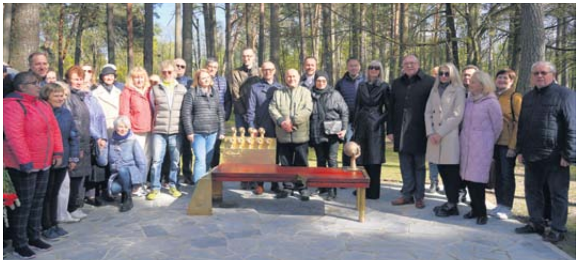
K. Dineikos atminimui skirtas suolelis buvo pastatytas K. Dineikos sveikatingumo parke