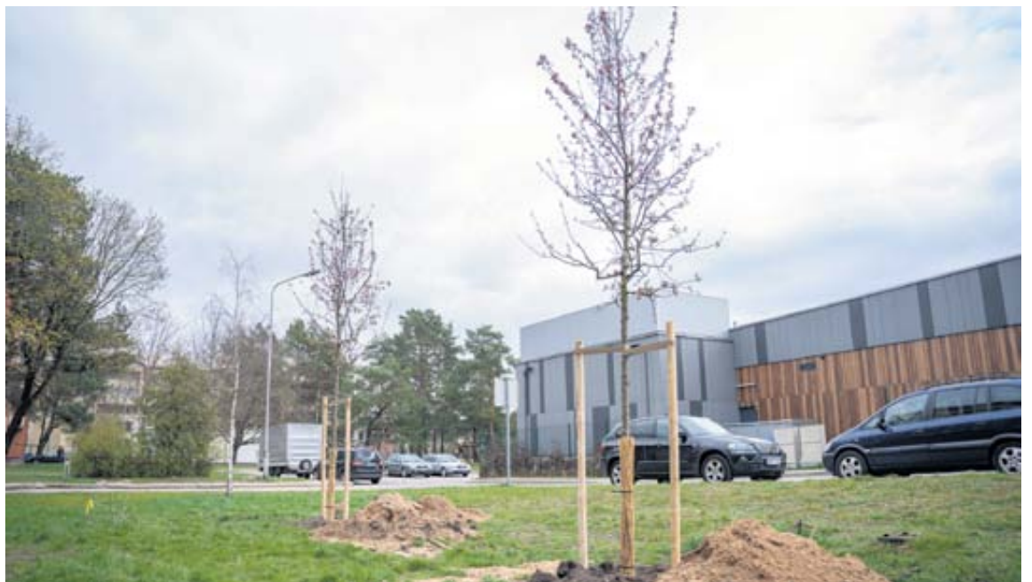
Šį pavasarį įvairiose Druskininkų erdvėse pasodinta daugiau kaip 100 įvairių rūšių medžių