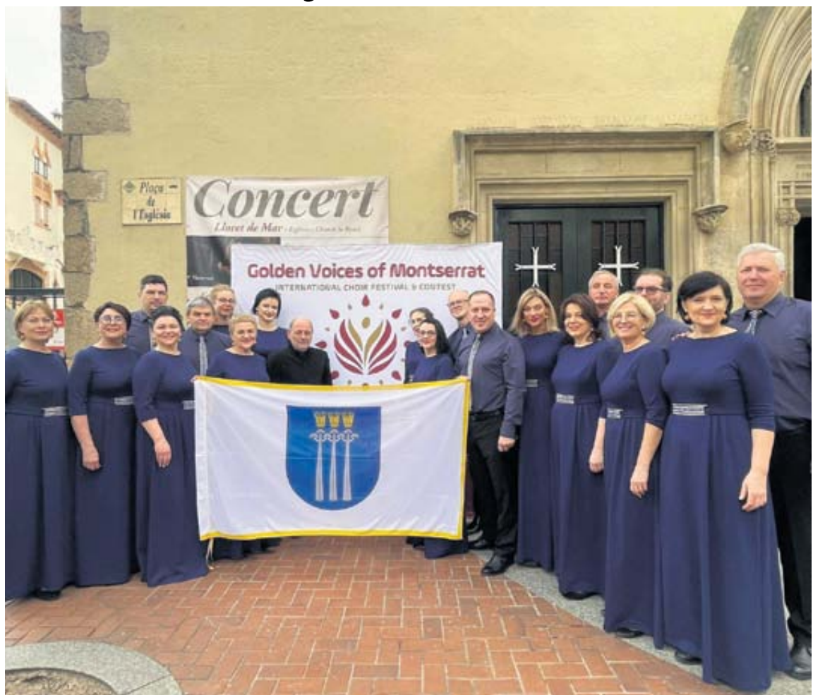
Choras „Druskininkai“ savo gimtajam miestui atstovavo Ispanijos Lorret de Mar mieste organizuotame konkurse – iš jo sugrįžo su sidabro diplomu

Tikimės, kad sėkmė ir toliau mus lydės ir Lietuvoje, ir užsienyje. Juk mes – choras „Druskininkai“!