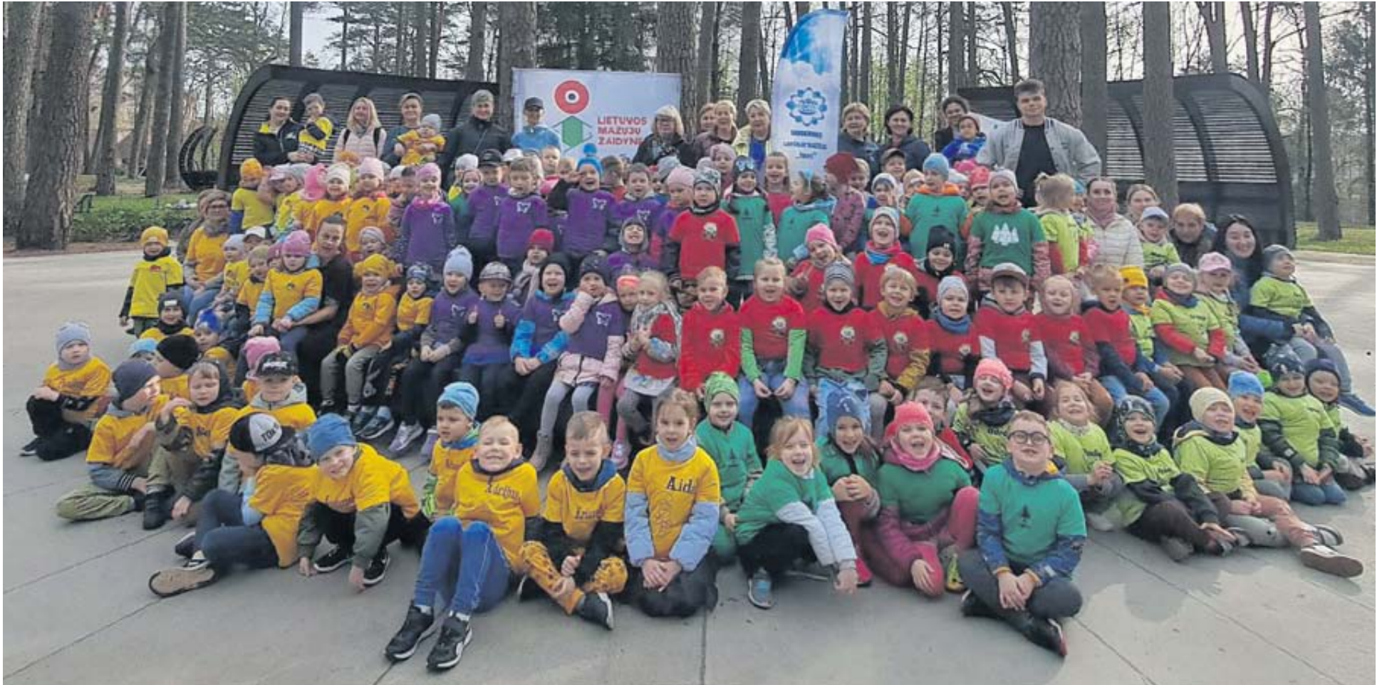
K. Dineikos sveikatingumo parke mažieji aktyviai sportavo, žaidė įvairius judriuosius žaidimus gryname ore ir smagiai leido laiką

Ikimokyklinio ugdymo įstaigas lankantys vaikai du kartus per savaitę dalyvauja kūno kultūros užsiėmimuose, tačiau augančiam vaikui nepakanka. Ikimokyklinis amžius yra palankiausias formuoti įgūdžius, įpročius ir gyvenimo nuostatas, taigi tai įgyvendinti padeda projektas „Lietuvos mažųjų žaidynės“.