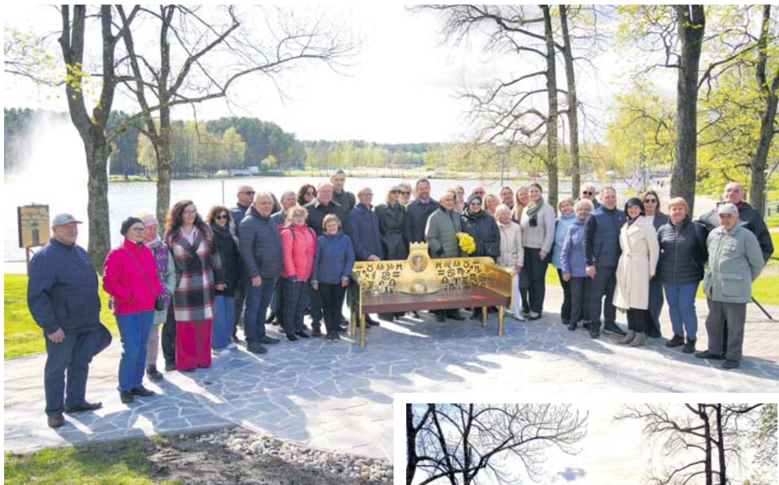
Druskonio ežero pakrantė M. K. Čiurlionio atminimo suolelio pastatymui parinkta neatsitiktinai – iškilus mūsų tautos kūrėjas žavėjosi Druskininkų gamta, čia gyveno ir kūrė